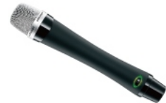
EJ-501TI میکروفن دستی